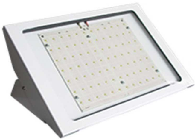
LEDS BI lighting